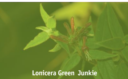
Lonicera Green Junkie