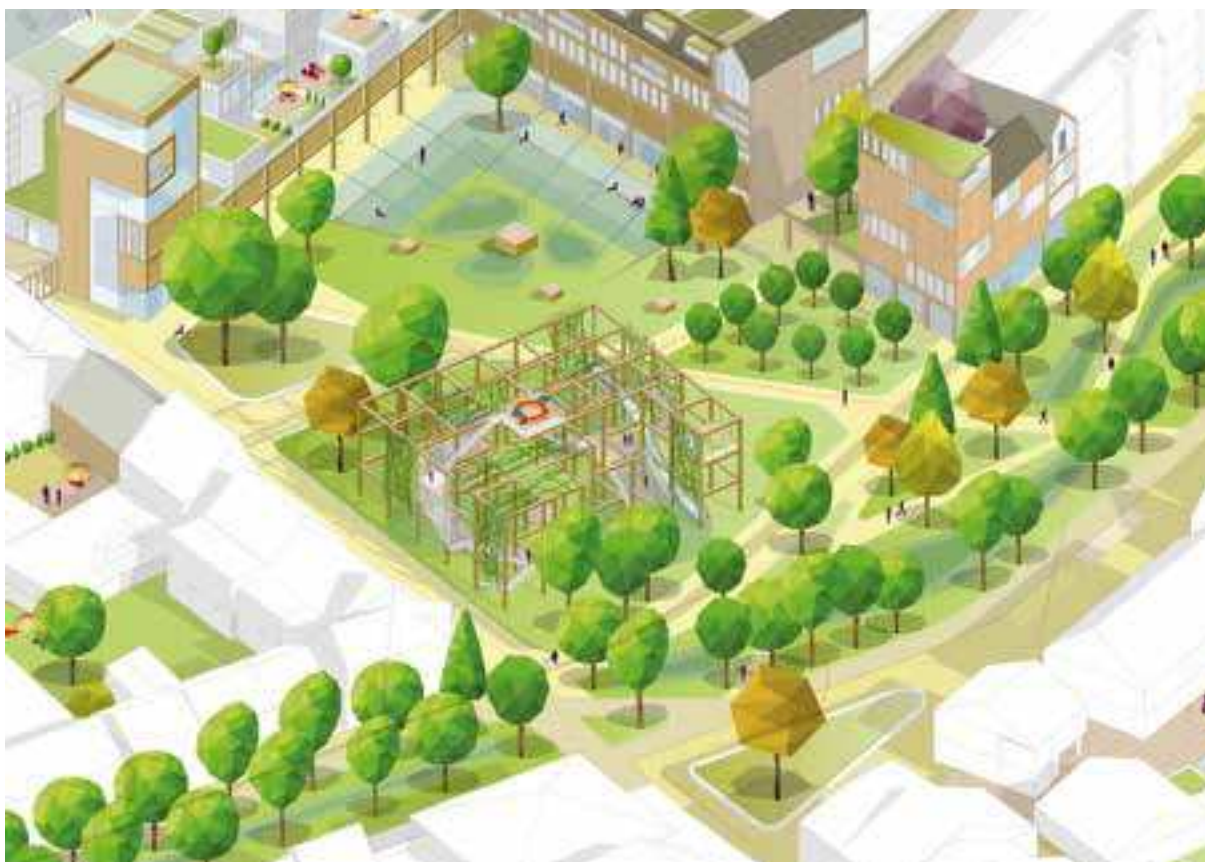
Voorbeelduitwerking van het Collegeplein. Het plein is een voormalig schoolterrein, maar in de huidige situatie een parkeerterrein waaraan achterkanten grenzen. In deze voorbeelduitwerking wordt de openbare ruimte van het Collegeplein opengemaakt richting de Singel, geïnspireerd op het voormalige open voorterrein met moestuinen van het Bisschoppelijk College.

voor de gemeente Weert om zich aan te sluiten bij Stichting Steenbreek om zo ook haar inwoners te enthousiasmeren om de tuinen te vergroenen. Daarnaast kent de gemeente een afkoppelregeling en doet ze mee aan de campagne Waterklaar.