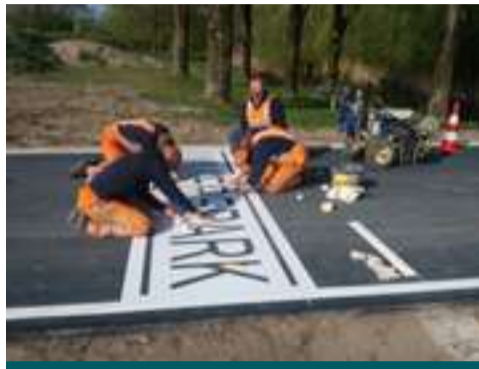
Groene Loper Pagina 4 en 5