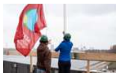
Het hoogste punt van de Aeres Hogeschool werd op 11 maart bereikt dus ging de vlag in de top.

Het Food Forum is het Flevolandse paviljoen waar bezoekers tijdens Floriade kennismaken met de innovatiekracht van Flevoland op het gebied van voedsel. Het gebouw is gemaakt met circulaire bouwmaterialen en symboliseert