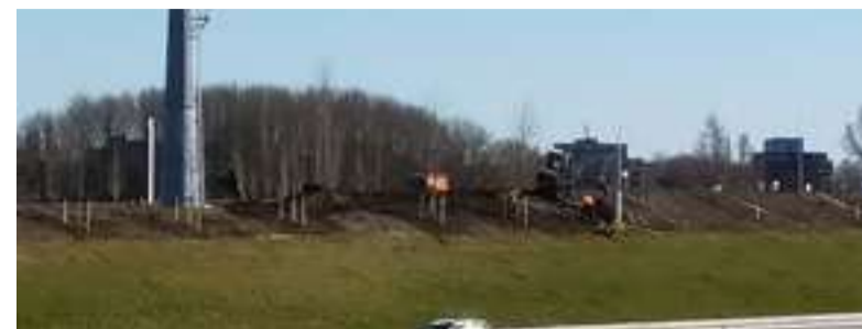
De bomen- en plantenbibliotheek is bijna compleet. De laatste bomen gaan de grond in.