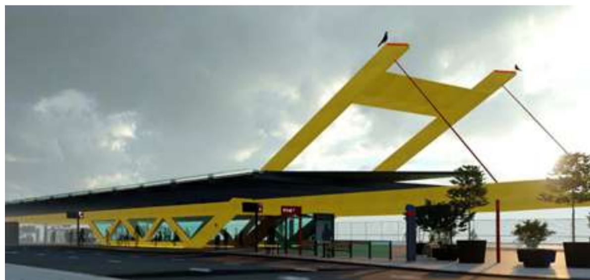
Reizigers staan door de overkapping uit de wind en de regen.