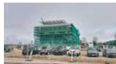
Aeres hogeschool in aanbouw.

het karakter van Flevoland: leven onder zeeniveau waar met durf en pioniersgeest veel mogelijk is. Zelfs eten produceren op de vruchtbare voormalige zeebodembodem.