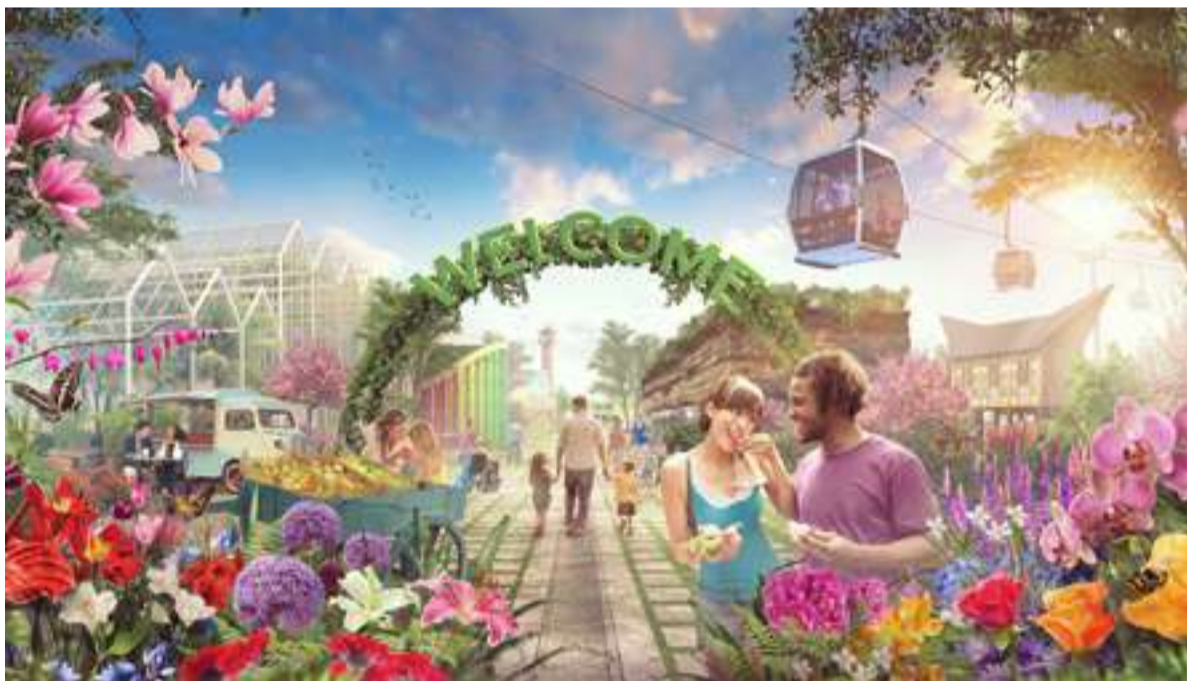
Een unieke ervaring om het Floriadepark vanuit de lucht te bekijken.