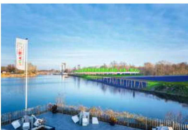
Mixed Reality: links de Beverbrug en rechts Rondje Weerwaterbrug