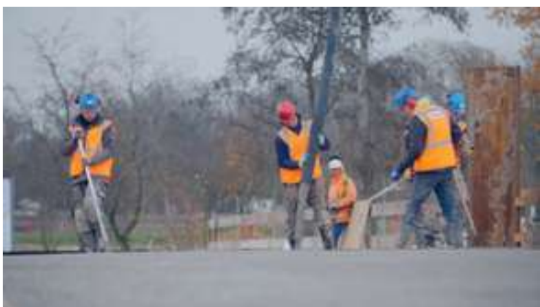
Starten van het cementloze beton voor Rondje Weerwaterbrug