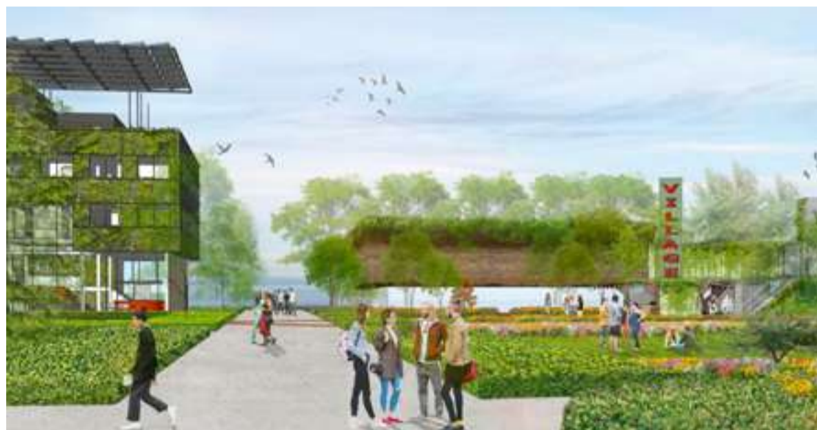
In Food Forum kunnen betrokkenen uit de hele voedselketen elkaar ontmoeten. Credit: Lijbers Architects

In de Village kunnen voedselstartups met een duurzaamheidsmissie hun eerste stappen in het