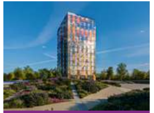
Opbrengsten Floriade Pagina 9, 10 en 11