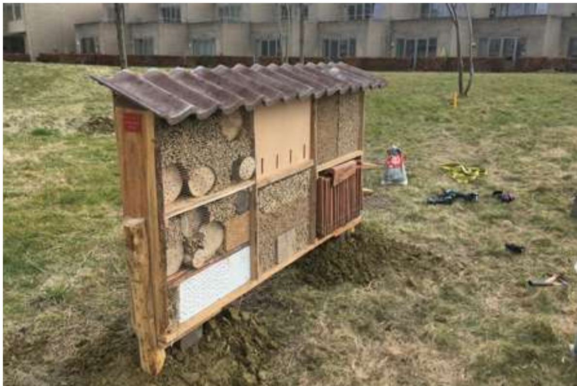
Bewoners in Poort hebben voor dit insectenhotel zelf leemzand geregeld waar enkele soorten bijen dankbaar gebruik van gaan maken.