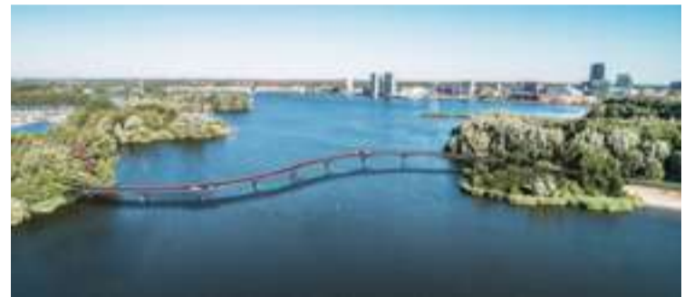
Artistimpressie van de brug