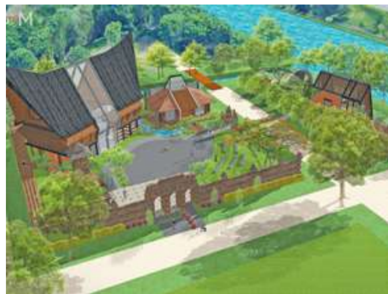
Artist impression 'The Wonderful Archipelago'.

Sven Stimac prees de inzendingen van Indonesië bij eerdere Floriades, actief met een zeer rijk cultureel