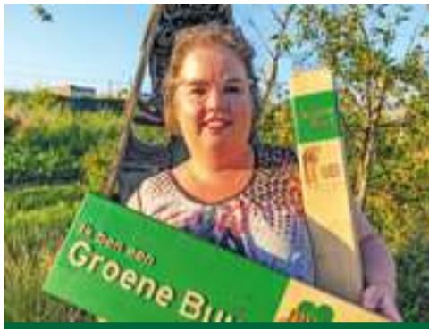
Groen & Gezond Almere Pagina 2 en 3