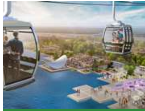
Floriade Expo 2022 Pagina 8