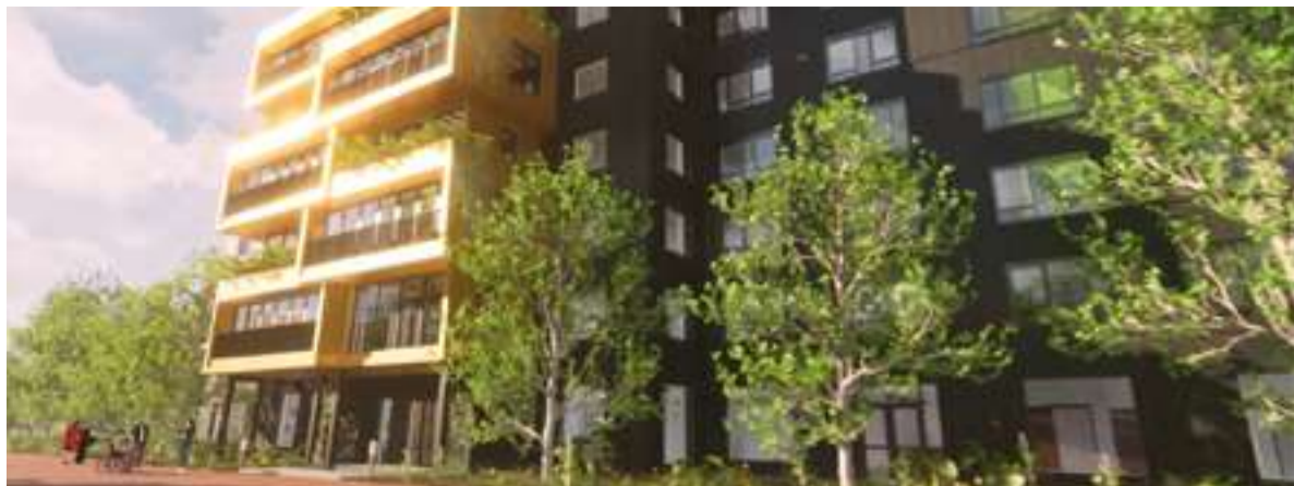
De toekomstige bewoners van dit zorgcentrum hebben uitzicht op een kleurrijk plein van Floriade.