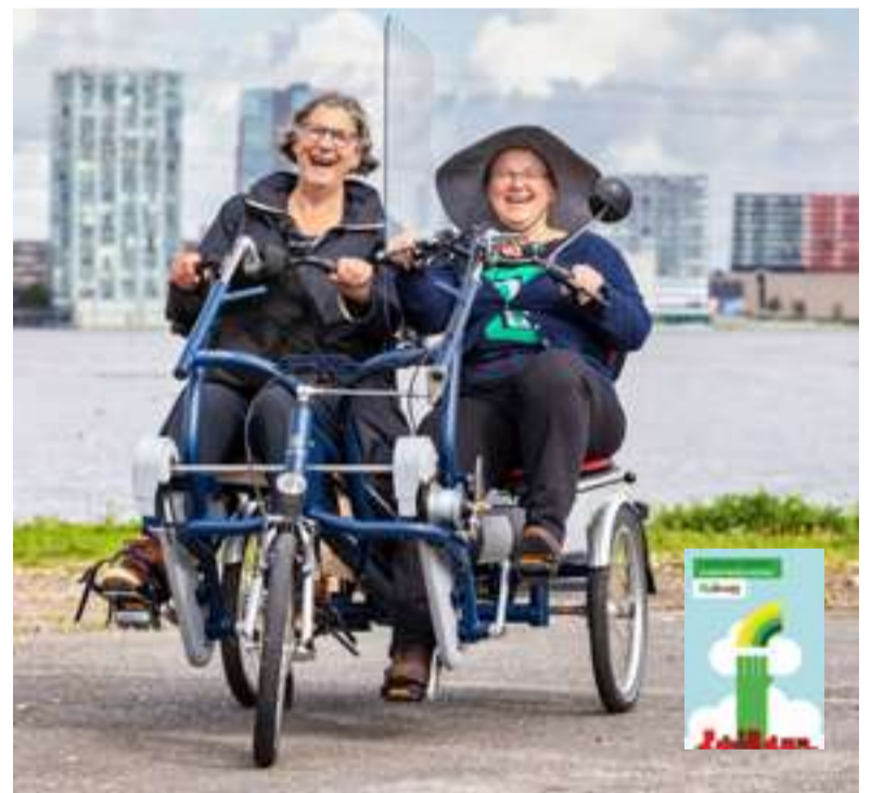
De duofiets is een initiatief van Fietsmaatjes Almere om samen naar Floriade te fietsen.